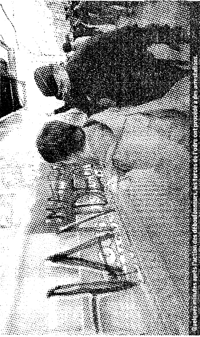
Quelques minutes après l'arrestation des débauchés, les forces de l'ordre ont procédé à des arrestations.

taire chef d'entreprise. La société de production Marthon, coupable pour le compte de TF1 de Sous le soleil , se promet de multiples rebondissements sur fond d'énigmes polétaires. Rien de bien nouveau, donc. TF1 et M6 ne sont pas en reste et préparent elles aussi leur feuilleton Seconde Chance devrait être diffusé sur la une courant septembre, tandis que M6 mijore non pas une mais deux séries : Pas de secret entre nous et Paris 16 . C'est attrait des chaînes pour le format du feuilleton s'explique par les bons scores d'audience espérés et les revenus publicitaires qui en découlent. Problème : quel sens a aujourd'hui, pour France 2, ce genre de programme, alors que Nicolas Sarkozy a exprimé sa volonté de supprimer la publicité sur les chaînes de France Télévisions ? France 2 arguera sûrement que la ministre de la Culture a demandé au groupe public de continuer à produire des programmes « populaires et de qualité ». En l'occurrence, la chaîne a tout privilégié le premier ad-