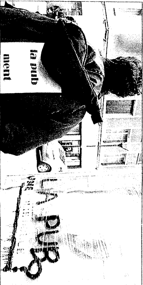
Les publicités sexistes en ont pris pour leur grade...

sont des obstacles pour la circulation des piétons » explique Manu, adhérent du collectif. Arrivés sur le marché, c'est le moment de glisser quelques mots aux militants venus tracts. Des questions sur l'éclairage public, sur les recettes publicitaires ou bien sur le règlement local. Un questionnaire a d'ailleurs été