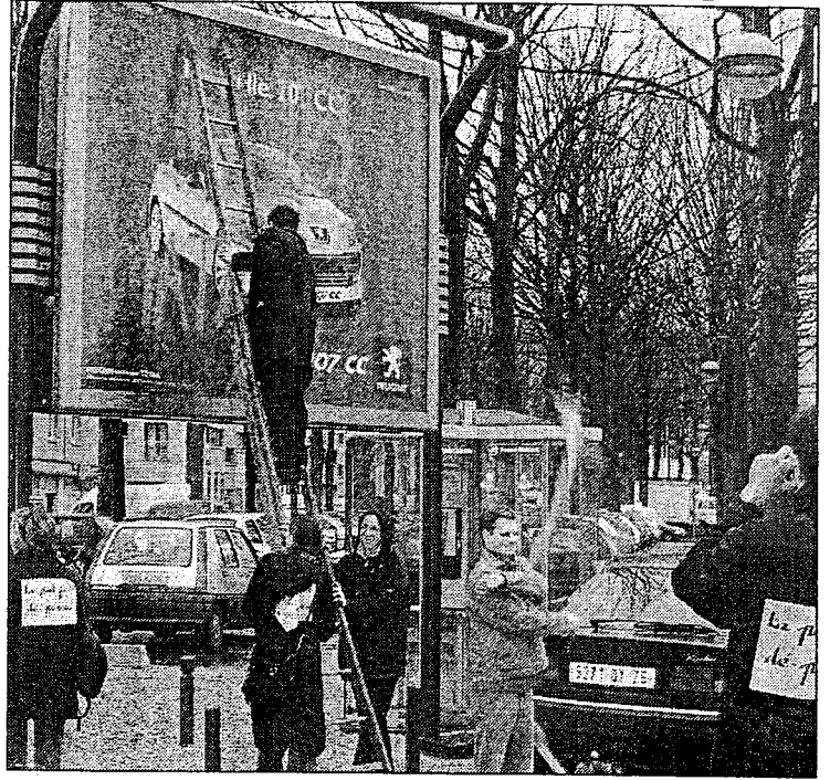
Le même jour, un peu partout en France, d'autres déboulonneurs déboulonnaient

Les déboulonneurs ont encore frappé. Samedi matin, ces anti-pub abusives ont réalisé un nouveau coup d'éclat en barbouillant deux panneaux 4 par 3 situés à proximité du conseil général. Une opération désormais rodée et qui suit une organisation très précise.