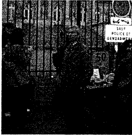
Le collectif des déboulonneurs estime qu'il alerte les citoyens...