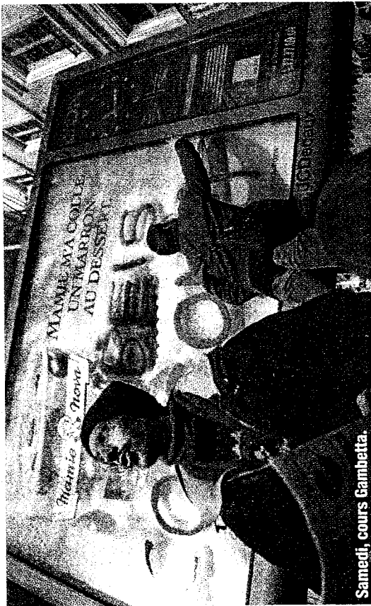
Samedi, cours Gambetta.

Créés en 2005 en région parisienne, les Déboulonneurs ne veulent pas éliminer la publicité de l'espace urbain mais limiter le nombre et la taille des panneaux. « Nous voudrions une loi qui impose un format maximum de 50 x 70 cm au lieu des 4 x 3 m. Nos actions ont pour but de créer le débat. » Le collectif, composé d'une quinzaine de jeunes mili-