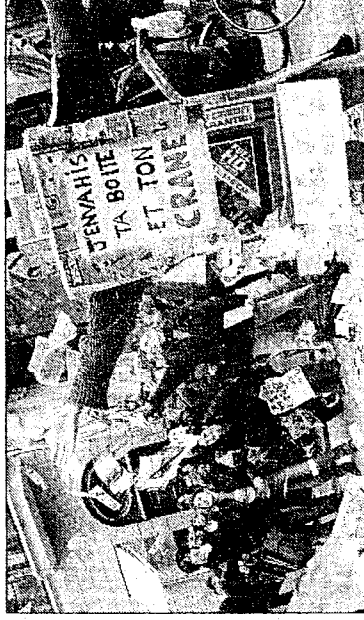
Sous une pluie de papiers, ses membres ont dénoncé pêle-mêle, « gaspillage » et « société de consommation »

H IER, en début d'après-midi, le collectif des « Débouonneurs de Lyon », plus habitué à démonter des succettes publicitaires, a dévotement défilé devant la Fnac, anciennement Le Progrès, des centaines de prospectus. Sous une pluie de papiers, ses membres ont dénoncé pêle-mêle, « gaspillage », « société de consommation », « pollution » et « coûts générés par l'incinération ». Détail de taille : ils ont ensuite ramassé le tout, bien contents de trouver à proximité une grosse poubelle grise.