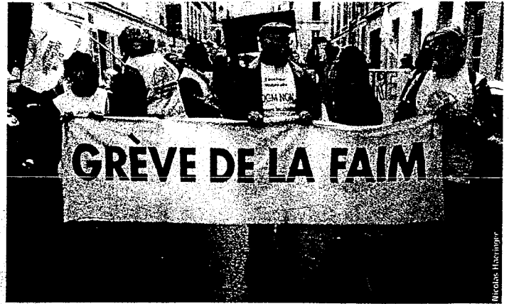
▲ Lors d'une grève de la faim, de nombreuses violences s'exercent : contre le corps du gréviste, contre ses proches... mais parfois la faim justifie les moyens ?

œuvre en interne un fonctionnement poussé allant dans ce sens, de revendiquer de se faire respecter tout en brandissant des slogans humiliants pour l'adversaire, de vouloir faire advenir la justice par la guerre ou la dévastation.