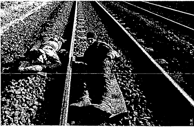
▲ Blocage de train : action très délicate car il faut que le chauffeur du train soit alerté... sans que les militants soient évacués. Le 7 novembre 2004, Sébastien Briat a été tué lors d'une telle action.